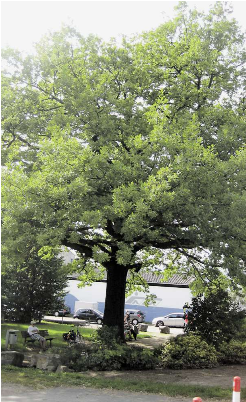
Die imposante 100-jährige Friedenseiche in Frei-Weinheim, unter der man eine erholsame Rast einlegen kann.

Wir sollten bei alledem nicht vergessen, dass es im Deutschland nach Napoleon 39 souveräne Staaten mit durchaus unterschiedlichen Interessen gegeben hat. Das galt auch im Hinblick auf den Vereinigungsprozess und dessen Umstände, innerhalb und außerhalb des alten Reiches. Dazu hat vor allem der Streit über eine großdeutsche Lösung (unter Einbeziehung Habsburgs – also Österreich-Ungarns und Teile Italiens) beziehungsweise eine kleindeutsche, also ohne diese, beigetragen. Der preußische Ministerpräsident Otto von Bismarck hat sich 1866 zum Krieg gegen Österreich und damit für die kleindeutsche Lösung entschieden. Das führte zum Erfolg. Der Bismarcktum von In-