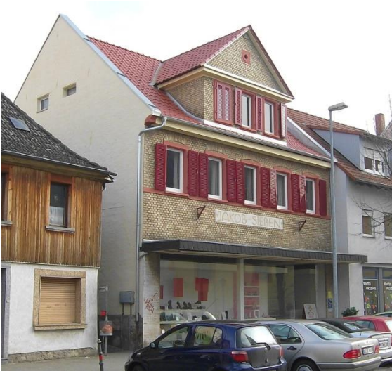
2022, das ehemalige Schuhhaus von Jakob Sieben, Pariser Straße Nr. 100. 24