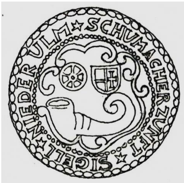
Umzeichnung des Zunftsiegels. 3