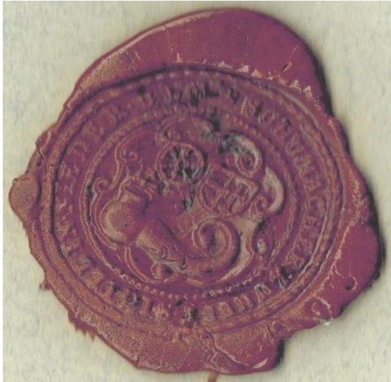
Siegelabdruck der Schuhmacherzunft Nieder-Olm. 2

Als einziges Siegel der Handwerker in Nieder-Olm hat sich das undatierte Zunftsiegel der Schuhmacher erhalten. Ihre Zunft wird in der Zunftliste der Amtsvogtei Nieder-Olm von 1784 genannt, dürfte aber bereits vor dieser Zeit bestanden haben. 1