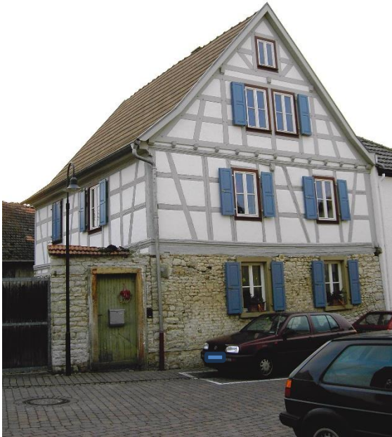
Ehemaliger St. Petershof, Kleine Wassergasse Nr. 13. 1

Einen der letzten Fachwerkhäuser in Nieder-Olm findet man in der Kleinen Wassergasse Nr. 13. Dort hatte sich das St. Peter Stift bei Mainz mit einem Hofgut etabliert. Eine 2022 von Karl Horn entdeckte und bisher unbeachtete Spolie in dem Anwesen mit der noch lesbaren Jahreszahl aus den 1570er Jahren, weist auf das frühe Alter der Hofanlage hin. Die jetzigen profanen Gebäudeteile dürften jedoch aus einer späteren Zeit stammen, da Nieder-Olm wiederholt gebrandschatzt wurde, letztmals 1691 während des Pfälzischen Erbfolgekrieges.