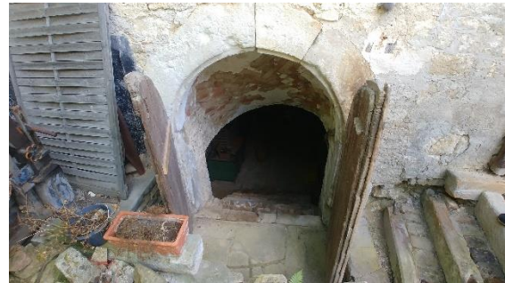
Kellerniedergang im Scheunenbereich. 4