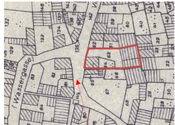
Kleine Wassergasse 1839, Katasterplan. 20