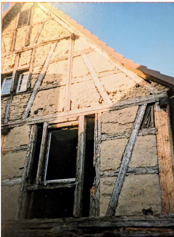
Bauzustand nach Freilegung des Fachwerks. 24