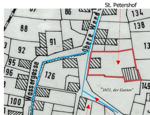
1651, die Badstub Kleine Wassergasse 1810, französischer Katasterplan, Nachzeichnung. 19

Nachkommen erworben, das sich noch bis heute in deren Besitz befindet. 18