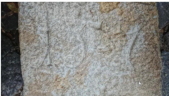
Spolie den 1570er Jahren. 2

Einen der letzten Fachwerkhäuser in Nieder-Olm findet man in der Kleinen Wassergasse Nr. 13. Dort hatte sich das St. Peter Stift bei Mainz mit einem Hofgut etabliert. Eine 2022 von Karl Horn entdeckte und bisher unbeachtete Spolie in dem Anwesen mit der noch lesbaren Jahreszahl aus den 1570er Jahren, weist auf das frühe Alter der Hofanlage hin. Die jetzigen profanen Gebäudeteile dürften jedoch aus einer späteren Zeit stammen, da Nieder-Olm wiederholt gebrandschatzt wurde, letztmals 1691 während des Pfälzischen Erbfolgekrieges.