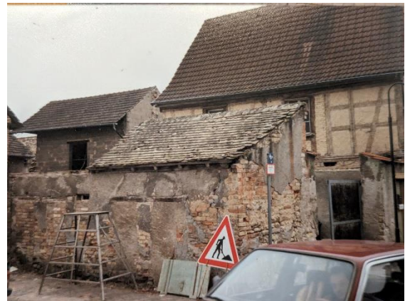
Alter Bauzustand und begonnene Sanierungsarbeiten. 25