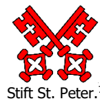
Stift St. Peter. 7

"Daß stiefft zue St. Peter bey Mayntz hat fallen von 36 morg[en] äcker und wießen 14 mlr. korn". 6