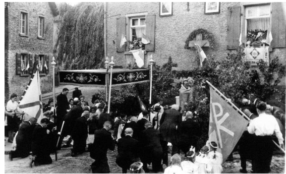
1950er Jahre, Fronleichnam mit Pfarrer Vitus Becker. Station am Straßenkreuz vor der Domherrnstraße Nr. 2, Ecke Pfarrgasse-Domherrnstraße. 31