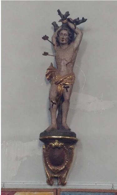
Skulptur des St. Sebastian in der kath. Pfarrkirche. 5