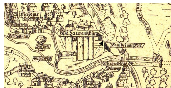
1577, die Burgkapelle St. Laurentius. 20

Damit endeten auch die seit 1503 bekannten alljährlich durchgeführten Prozessionen zur Laurentiuskapelle.