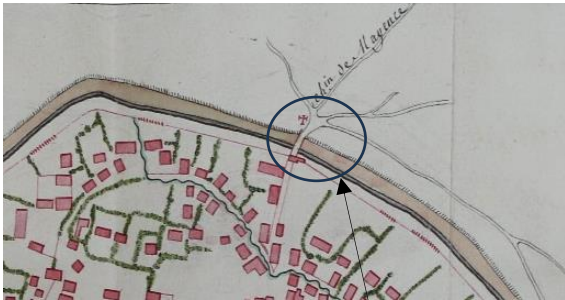
1735, die Kapelle am Mainzer Tor wurde mit einem Kreuz markiert. 59

Kreuzstraße, weiter zum Heiligenhäuschen an der Wingertsmühle. Die Kapelle musste wohl 1806 dem Bau der Pariser Straße weichen, dem auch die Mainzer Pforte zum Opfer fiel.