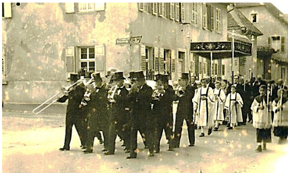
1950, Fronleichnamprozession in Begleitung der Vereinigten Musikkapelle an der Straßmündung Kreuzstraße in die Pariser Straße. 30

Nach der Denkmalliste soll das Straßenkreuz aus dem Jahr 1785 stammen. Das Straßenkreuz wurde 2021 erneuert.