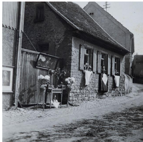
1950er Jahre, Fronleichnamprozession. Das geschmückte Haus der Familie Stohr in der Pfarrgasse Nr. 12. Im Vordergrund der gestreute traditionelle Grasteppeich auf der Straße. 33