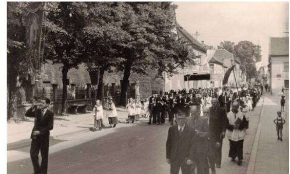
1950er Jahre, Fronleichnamprozession in der Pariser Straße, links der noch eingefriedete Kirchhof. 43

Aus den 1950er Jahren sind auch Flurprozessionen zum Feldkreuz oberhalb der Mittleren Ecklochermühle , heute Kreuzhof, bekannt.