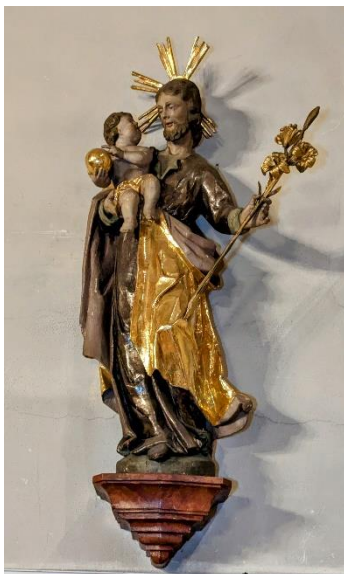
Skulptur des St. Josef in der kath. Pfarrkirche. 8