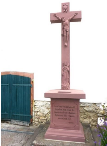
2021, Straßenkreuz mit dem Relief der Hl. Katharina. 29 Inscription:

Von der Kirche die Pfarrgasse hoch zum Straßenkreuz an der Ecke Pfarrgasse und Domherrnstraße.