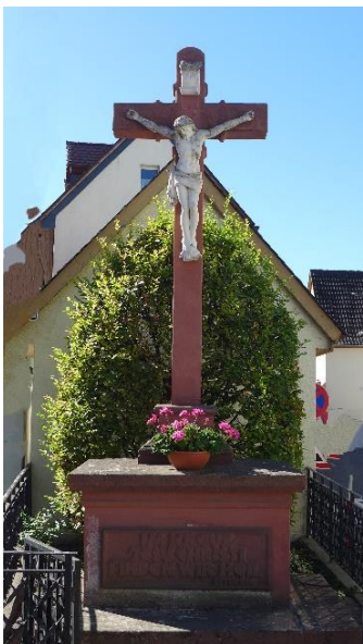
Straßenkreuz an der Oppenheimer Straße. 35 Inschrift: Im Kreuz Jesus Christi finden wir unser Heil.