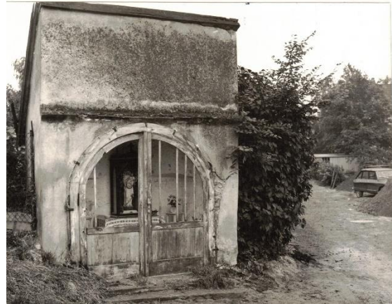
1979, ruinöser Bauzustand. 49