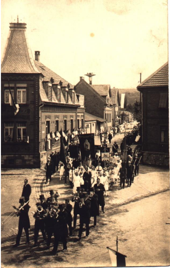
1920er Jahre, Fronleichnamprozession, Ecke Wallstraße-Bahnhofstraße. 34

Der Weg führte weiter durch die Domherrnstraße, die Wallstraße hinunter zum Straßenkreuz an der Ecke Oppenheimer Straße und Wilhelm-Holzamer-Weg.