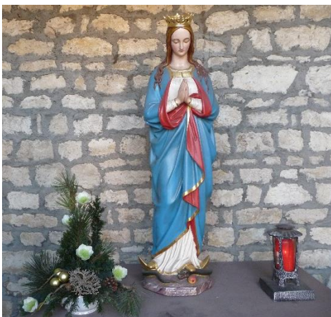
Das 1979 sanierte Heilighäuschen Am Woog. 54