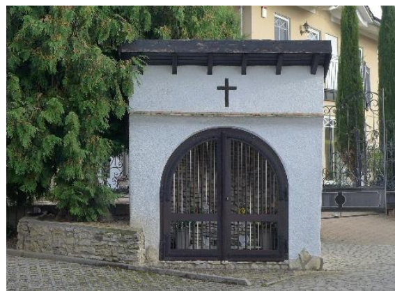
Heutiger Bauzustand. 50

Später hat sich die Zuständigkeit geklärt und liegt nunmehr in Händen der katholischen Kirchengemeinde Nieder-Olm.