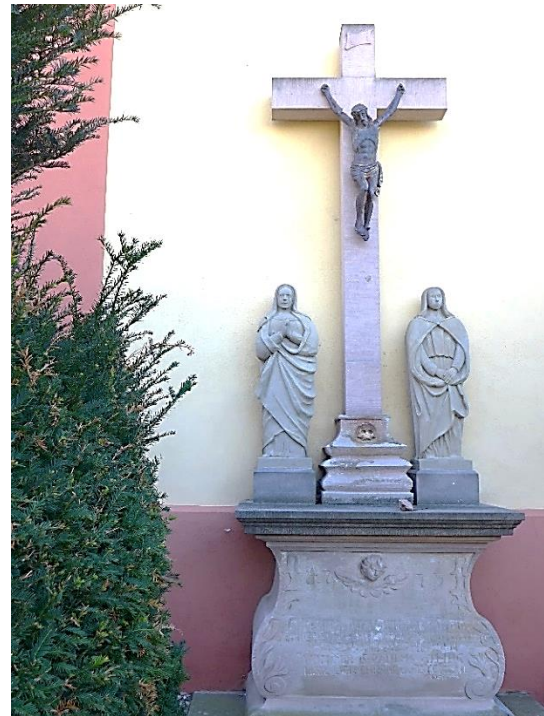
Kreuzigungsgruppe von 1773. 61

Die Kreuzigungsgruppe diente wohl auch als kleine Haltestation bei den Prozessionsumzügen um die Kirche in den Wintermonaten, am Montag nach St. Sebastiani im Januar und der Hl. Katharina im November.