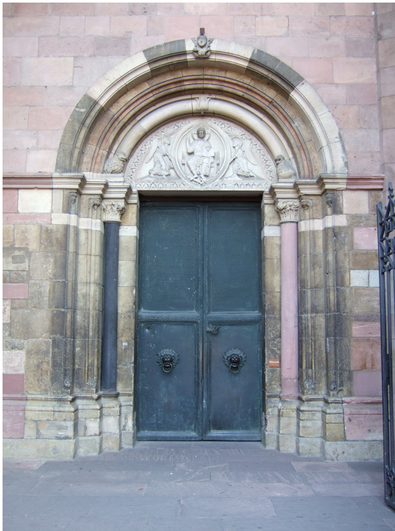
Bronzetür, Marktportal Mainzer Dom

Im selben Jahr wurde der Inhalt dieser Urkunde als Inschrift auf den oberen beiden Feldern der Bronzetüren am Marktportal des Mainzer Doms verewigt. Man folgte dabei dem Vorbild des einst zu Speyer über dem Domportal 1111 eingegrabenen Stadtprivilegs. 20