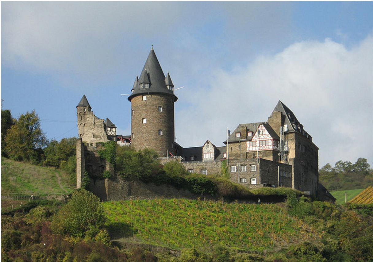
Burg Stahleck, Bacharach

Auf einem Felsporn über der Stadt Bacharach thront die Burg Stahleck. 1 „Stahl“-Namen deuten oft auf eine alte Gerichtsstätte hin. 2 Eine Ableitung von „Stell-Eck“, wo sich die kölnischen Stiftsleute zu Fron- und Kriegsdiensten zu stellen hatten, wurde ebenfalls vorgeschlagen. 3 Auch wäre eine Herkunft des „Stahl“-Namens von stall bzw. stalle denkbar, was im Althochdeutschen soviel wie Gebäude oder Wohnung bedeutet. 4 Vermutlich setzt sich der Name aber aus dem mittelhochdeutschen stahel für Stahl und ecke , als Bezeichnung für einen Bergsporn in Burgennamen zusammen, was soviel wie stählerne, unbezwingbare Burg bedeutet. 5