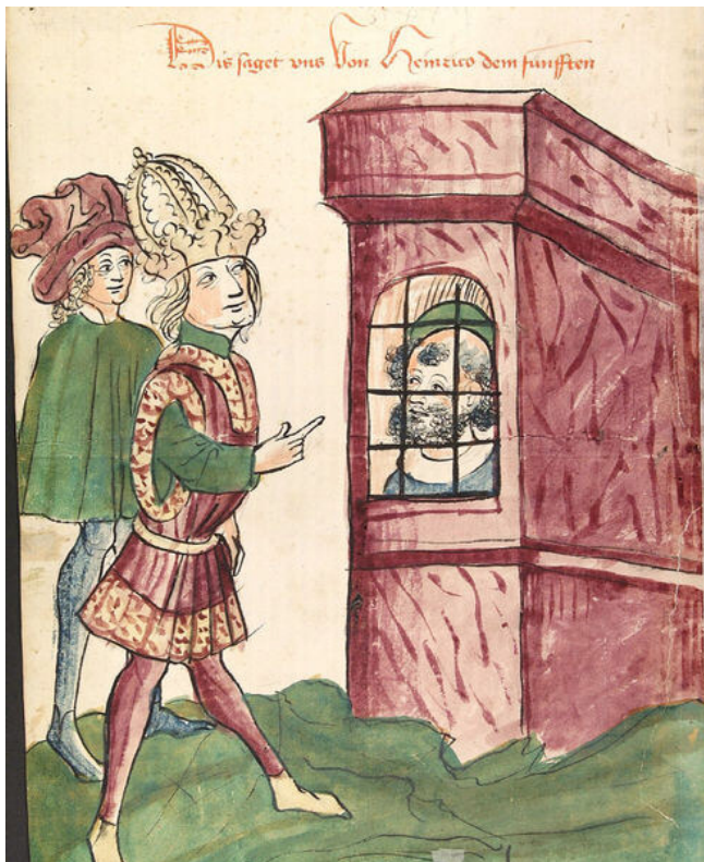
Kaiser Heinrich und sein gefangener Vater, Zeichnung um 1450

Seit den Ottonen wirkte der deutsche Kaiser mit dem Hinweis auf das Eigenkirchenrecht an der Einsetzung von Geistlichen mit. Da sich die Kirchen auf ihrem Grund und Boden befanden, fühlten sich die ottonischen Herrscher als Eigentümer und wollten deshalb auch das eingesetzte Personal bestimmen. Die katholische Kirche sah darin eine Beschneidung ihrer Machtbefugnisse und nahm zurecht an, dass bei der Bestimmung der Geistlichen mehr auf die Loyalität gegenüber dem Landesherren, als auf Eignung und Loyalität gegenüber der Kirche geachtet wurde. Der Streit brach offen aus, als Heinrich IV. im Erzbistum Mailand einen vom Papst exkommunizierten Erzbischof einsetzen wollte. Im Zuge dieser Streitigkeiten wechselte Konrad 1093 in das päpstliche Lager und wurde fünf Jahre später von seinem Vater als Mitkönig abgesetzt. 1099 bestimmte der Vater seinen Bruder Heinrich als Mitkönig. Der deutsche Adel wollte den Ausgleich mit dem Papst, und es stand zu befürchten, dass - wie bereits im Jahr 1077 geschehen - ein Gegenkönig gewählt würde. Heinrich sah seine Chance, einmal König und Kaiser zu werden, schwinden. Daher verbündete er sich mit dem deutschen Hochadel, brachte Papst Paschalis II. auf seine Seite und ließ seinen Vater, Heinrich IV., auf Burg Bockelheim gefangen setzen. Schließlich zwang er ihn, in der Ingelheimer Kaiserpfalz abzdanken.