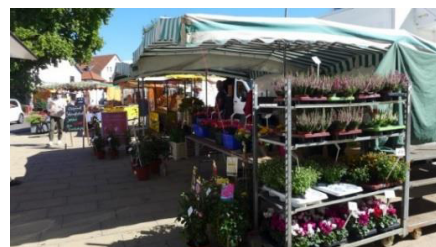
2020, Wochenmarkt auf dem Rathausplatz. 7

Das Hofgut von Jacob Kraetzer und seinen späteren familiären Nachfolgern überstand alle Zeiten, bis die Gemeinde 1959 das Anwesen, einschließlich der noch beachtlichen Reste der Laurenziburg, erwarb. Im gleichen Jahr begann die Niederlegung der baulichen Anlagen. 6 Das nun große freigewordene Areal bot nun Platz für den Neubau des Rathauses für die Verbandsgemeinde- und Stadtverwaltung Nieder-Olm. Der heutige attraktive Rathausplatz mit gastronomischem Umfeld und Marktgeschehen wurde 2009 fertiggestellt.