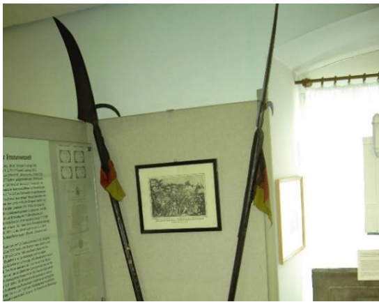
Sensen als Waffen der rheinhessischen Freischärler. 13

1849, Kampf der rheinhessischen Freischärler in Kirchheimbolanden. 12