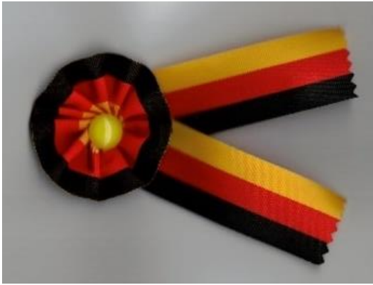
1848/49, Kokarde Schwarz-Rot-Gold. 10