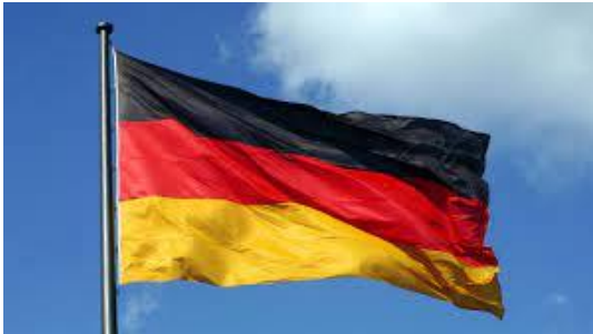
Die heutigen Nationalfarben Schwarz-Rot-Gold. 1