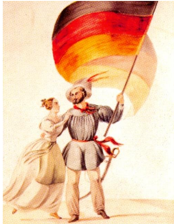
Freischärler von 1849. 3

und Freischärlern auf. Das politische Zentrum des Aufstandes für unsere Region war in Mainz verankert. Ludwig Bamberger und Franz Zitz in Mainz waren die Führer des ausbrechenden Aufstandes von 1848/49.