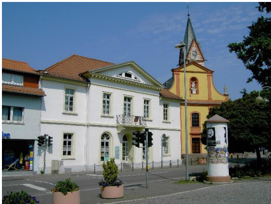
Das alte Rathaus von 1827. 6