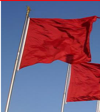
"Die Fahne des Rathauses habe rot zu sein". 7