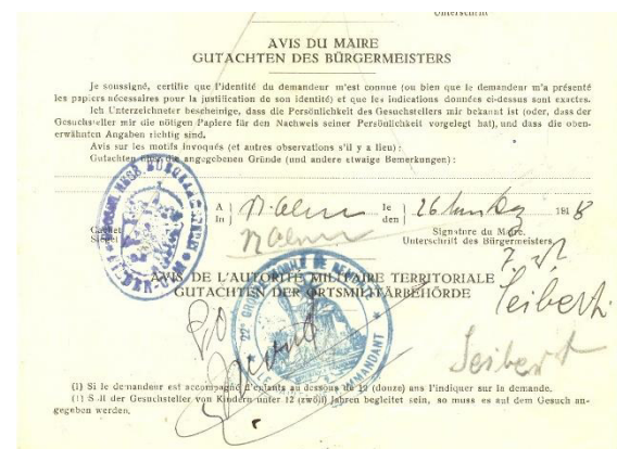
Geleitschein im nun französisch besetzten Nieder-Olm vom 27.12.1918. 8

Die französische Besatzungsarmee traf am 10. Dezember 1918 in Nieder-Olm ein und übernahm zunächst die Verwaltung. Somit war die Zeit des Arbeiter- Soldaten- und Bauernrats in Nieder-Olm beendet.