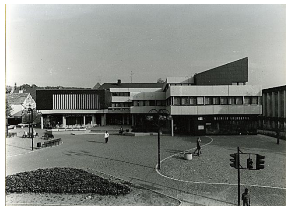
1978, das neue Rathaus der Verbands- und Ortsgemeinde Nieder-Olm. 12

Kürzlich 9 war ich nach langen Jahren wieder einmal dort. Das Haus der "Ritsch" steht noch mit seinem Hof und den Bäumen, unter denen sich einst ein Biergarten befand. Aber es ist ganz entzaubert, denn es hat jetzt ein multifunktionales Rathaus in seiner Nachbarschaft. Und wo sich einmal das verschwiegene Gärtchen eines großen Bauernanwesens 10 befand, geht's jetzt zur Schultüre eines Gymnasiums 11 hinein. An der Stelle ehemaliger Remisen dehnt sich ein Parkplatz, selbstverständlich nach der Norm "begrünt" . Doch die Kirche scheint weggerückt und kleiner geworden zu sein. Das Dorf hat seinen Kern saniert.