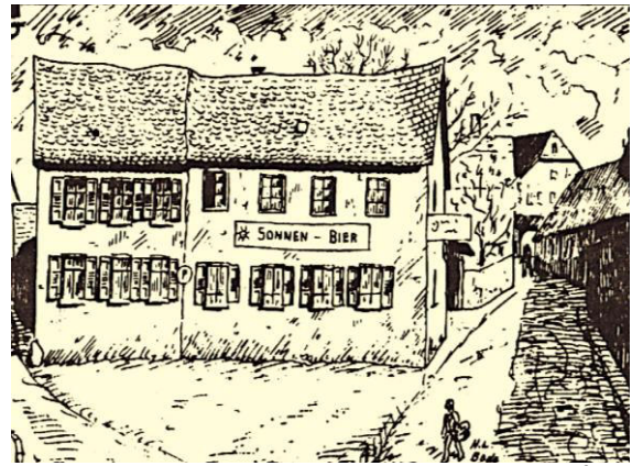
1934, die "Ritsch" , Gasthaus Ambach, Pfarrgasse 2. 8

Kürzlich 9 war ich nach langen Jahren wieder einmal dort. Das Haus der "Ritsch" steht noch mit seinem Hof und den Bäumen, unter denen sich einst ein Biergarten befand. Aber es ist ganz entzaubert, denn es hat jetzt ein multifunktionales Rathaus in seiner Nachbarschaft. Und wo sich einmal das verschwiegene Gärtchen eines großen Bauernanwesens 10 befand, geht's jetzt zur Schultüre eines Gymnasiums 11 hinein. An der Stelle ehemaliger Remisen dehnt sich ein Parkplatz, selbstverständlich nach der Norm "begrünt" . Doch die Kirche scheint weggerückt und kleiner geworden zu sein. Das Dorf hat seinen Kern saniert.