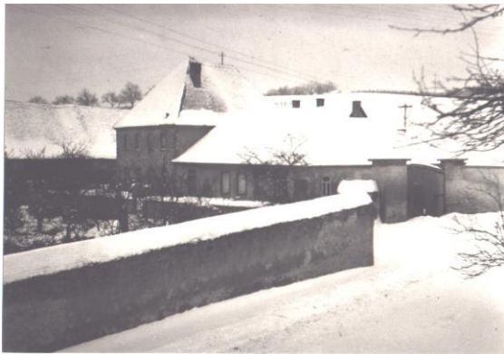
1929, die Wingertsmühle im Winter 16

So weit haben sich die Saugarme des Krakens Stadt inzwischen schon aufs Land herausgegriffen. Die alte Chaussee ist zu einer ordentlich asphaltierten Kreisverbindungsstraße 15 geworden. Dort hat mich einer angehupt, als ich nach den Türlen von Mainz Ausschau hielt. "Steht auf der Fahrbahn und träumt!" . Tatsächlich, es hat sich viel an Bebauung zwischen die Türme der Stadt und die ländliche Nachbarschaft geschoben.