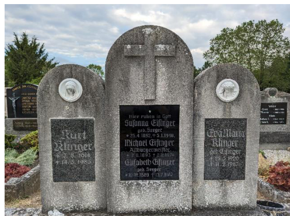
Grabmal der Familien Eifinger und Klinger. 5