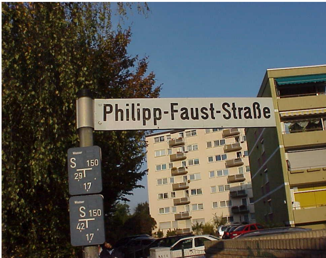
Die Gemeinde Nieder-Olm benannte 1963 zu Ehren und zur Erinnerung eine Straße nach Philipp Faust.