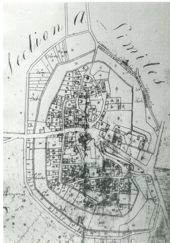
1810, Nieder-Olm im Katasterplan.