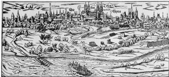
1500, Stadtansicht von Speyer nach Sebastian Münster. 8