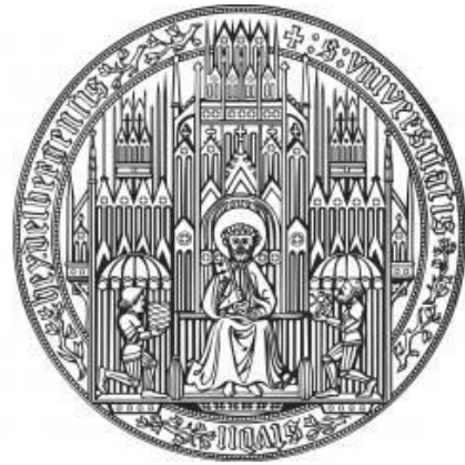
Siegel der Universität Heidelberg. 11