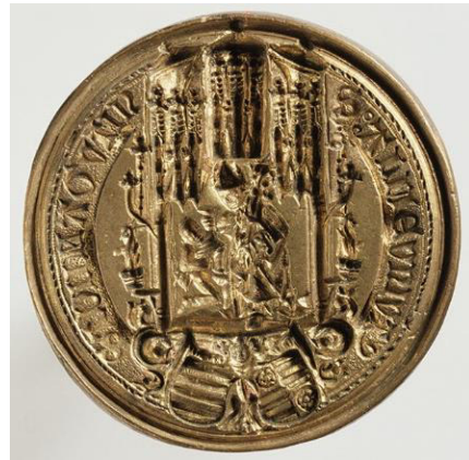
Siegel der Universität Mainz, um 1477. 4

Universität Mainz zu finden, das er dann an der Universität Heidelberg fortsetzte. 3