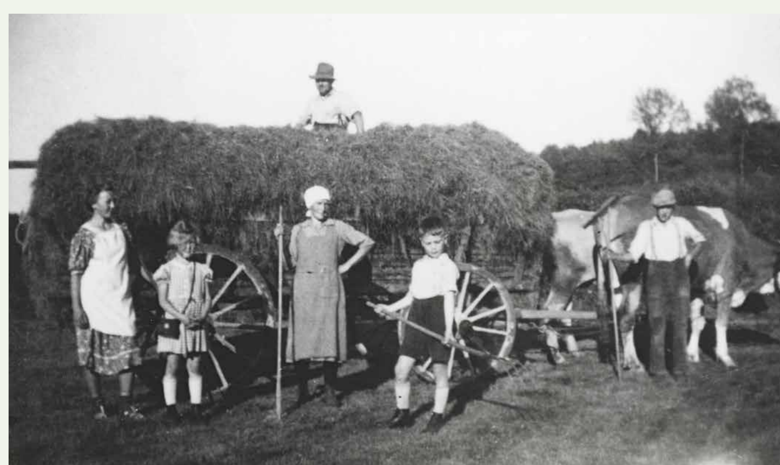
Heuernte in Ingelbach, heute Landkreis Altenkirchen, 1928

Die explosive Stimmung verdeutlicht der Sturm von ca. 2.000 Winzern auf das Bernkasteler Finanzamt 1926, der politische Folgen nach sich zog. Ab Mitte 1926 sollte eine groß angelegte Werbekampagne mit dem Titel „Trinkt deutschen Wein“ dessen Konsum im Inland stärken. Erst nach der Währungsreform war es einigen Bauern möglich, Maschinen wie Schlepper anzuschaffen. International war die deutsche Landwirtschaft nicht konkurrenzfähig. Mit dem Sturz der Agrarpreise in der Weltwirtschaftskrise 1929 stand der Sektor vor noch größeren Herausforderungen.