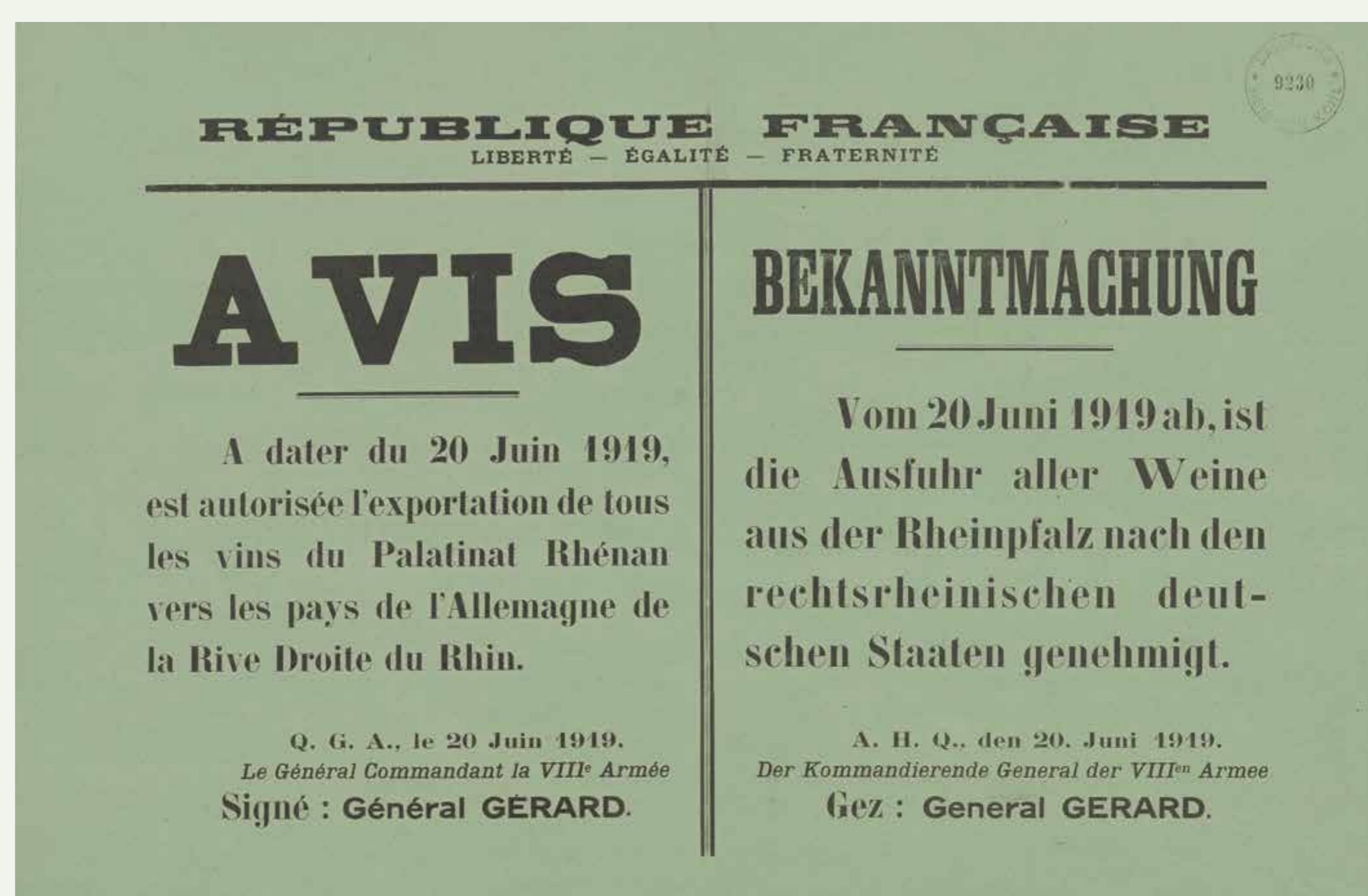
Aufhebung des Ausfuhrverbots, 20. Juni 1919

„Zu der Milchpreiserhöhung haben die Produzenten noch folgende Erläuterung für Betriebskosten gegeben: In Vorkriegszeiten kostete eine Kuh M 300 – 400,- jetzt Mark 200.000 bis 240.000 Mark, Verpflegung einer Kuh monatlich M 2,50, jetzt 500 Mark, ein Milchwagen 600 M, jetzt nur Reparatur 30.000,- Mark, ein Milchwagenpferd 700 Mark, jetzt 200.000 Mark, Beschlagen desselben 3 bis 4 Mark, jetzt 4.000 Mark, Futterrüben der Zentner 1,20 Mark, jetzt 500 Mark [...]. Diese Aufstellung ließe sich noch beliebig erweitern, dürfte aber genügen, um den Aufschlag der Milchpreise zu rechtfertigen.“ (Stadtarchiv Linz, P 33)