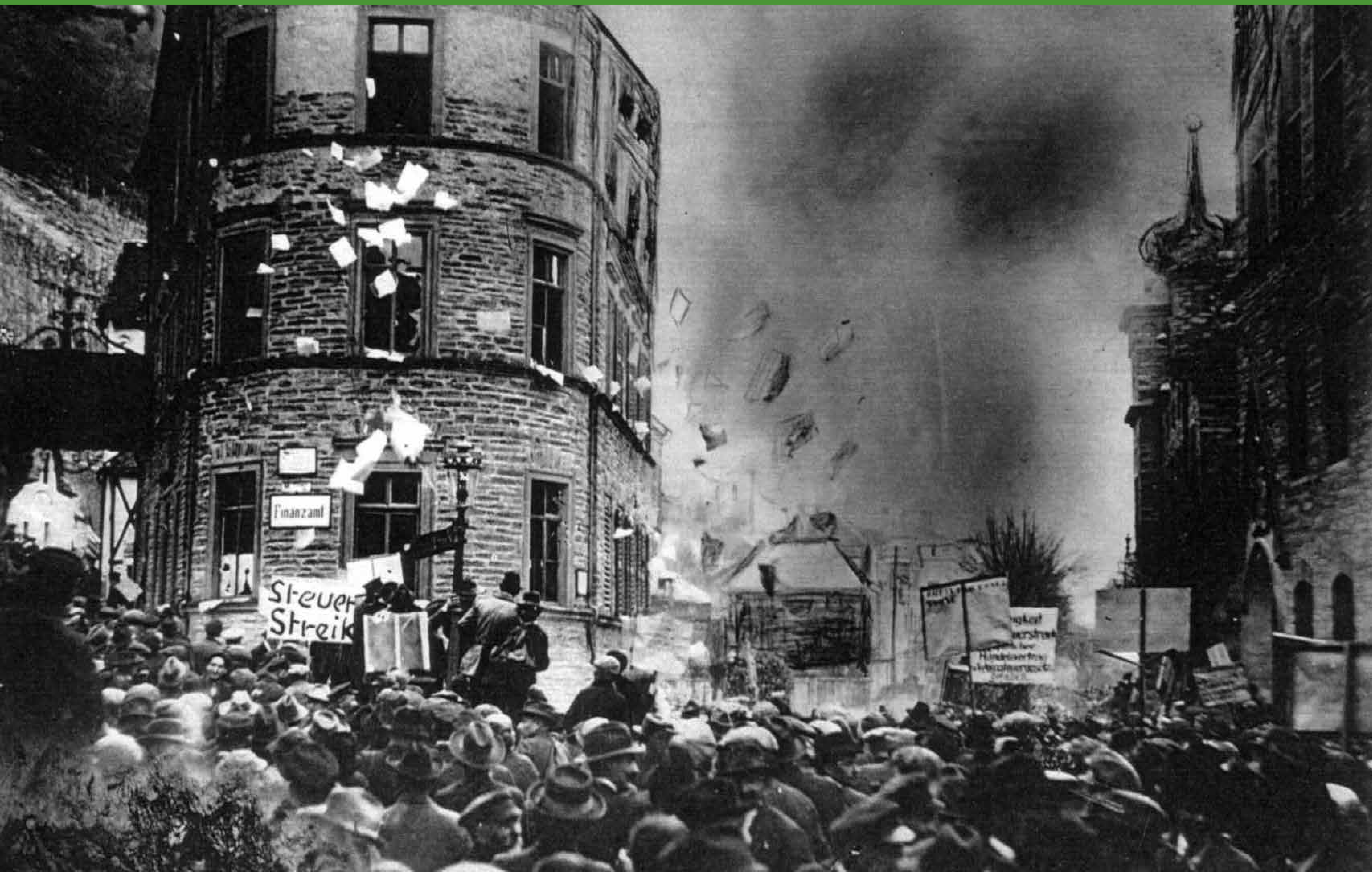
Stürmung des Bernkasteler Finanzamtes am 25. Februar 1926, nachträglich bearbeitete Aufnahme