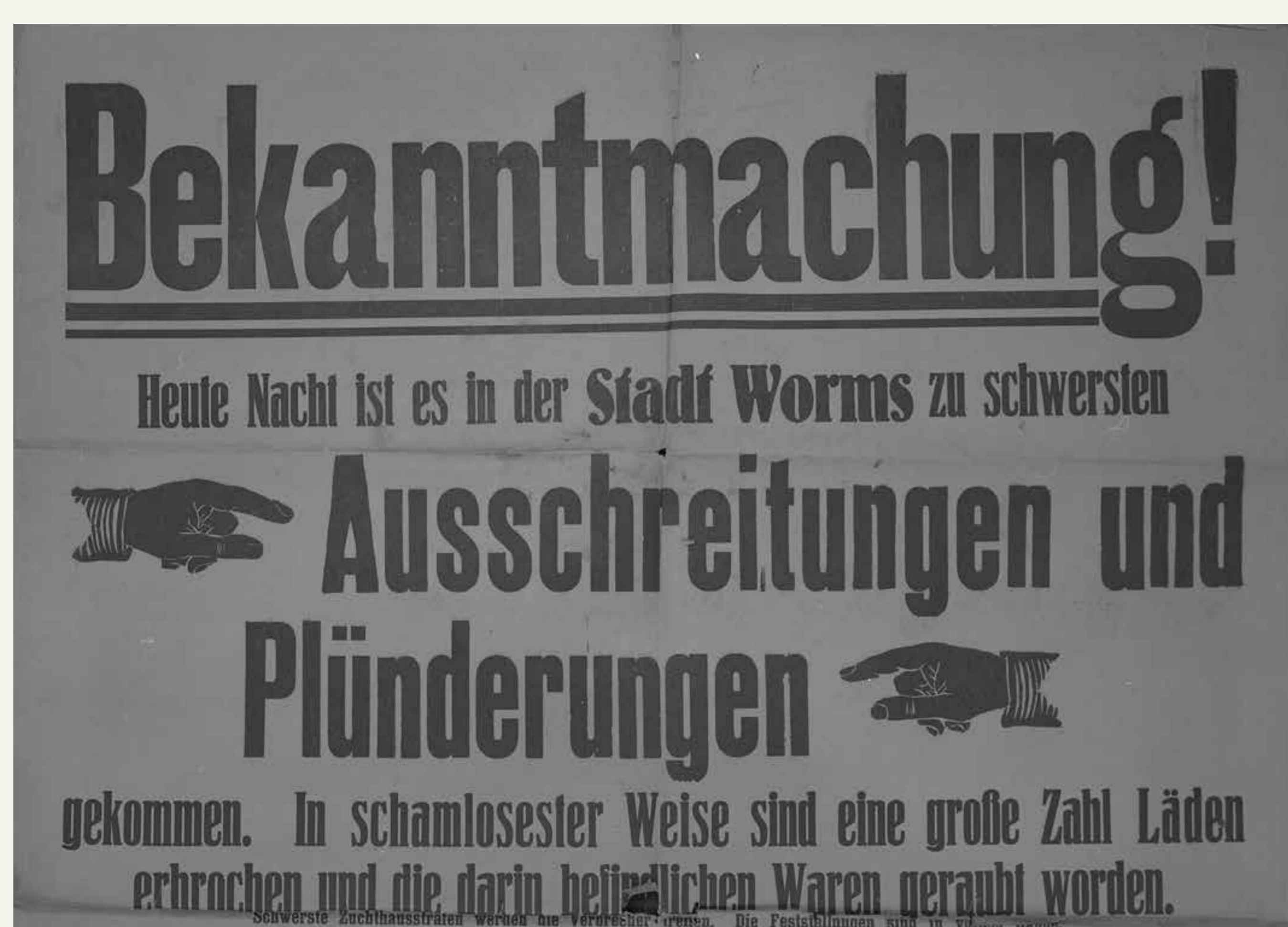
Aufforderung des Oberbürgermeisters von Worms, das Haus nicht zu verlassen, 1. Juli 1920

Höchstpreise für Grundnahrungsmittel, Mangel an Dünger, Zugtieren, Viehfutter und Arbeitskräften prägten bereits die Landwirtschaft im Krieg. Auch durch die Blockade der Alliierten mangelte es über das Kriegsende hinaus an Lebensmitteln, sodass Schleichhandel und Wucherpreise vorherrschten. Seit dem Hungerwinter 1917 kam es zu Protesten und Plünderungen durch die städtische Bevölkerung. Bei der Gründung von Arbeiter- und Soldatenräten im November 1918 waren zum Teil Bauern beteiligt. In der Bauernschaft bestanden unterschiedliche politische Vorstellungen. So gründeten sich im Jahr 1919 u.a. in Rheinhessen und der Pfalz die „Freien Bauern“, die mithilfe von Lieferstreiks gegen die Zwangswirtschaft eintraten. Die Zahl der Arbeitskräfte in der Landwirtschaft war seit Ende des 19. Jahrhunderts deutlich gesunken; in der preußischen Rheinprovinz um Koblenz und Trier arbeiteten hier 1925 nur noch 28 % der Erwerbstätigen. Sowohl beim Anbau von Roggen, Gerste, Hafer, aber auch Kartoffeln wurde 1925 noch nicht das Vorkriegsniveau erreicht. Der Krieg hatte auch die Viehbestände dezimiert. Der exportorientierte Weinbau verlor durch den Krieg langfristig einen Teil seiner Absatzgebiete. Hierzu trug die zeitweise Zollgrenze der Besatzungszone bei.