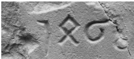
Jahreszahl 1468 als Spolie im Brunnenhäuschen des Kreuzgangs vermauert

Egal ob in Holz geschnitzt, in Bronze gegossen oder in Stein geschlagen gehören Inschriften – neben den archivalischen Überlieferungen – zu den wichtigsten Quellen in Kirchen und Klöstern. Umso bedauerlicher ist es, dass im ehemals so reichen Stift Ravengiersburg kaum etwas die Zeiten überdauert hat. Denn nach einer