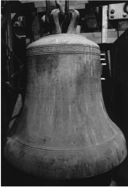
Glocke des sogenannten Trierer Hexametermeisters von 1431 (mit Minuskel-Inschrift, S. 5)

1072 wurde mit Zustimmung des Mainzer Erzbischofs Siegfried I. von Eppstein die im Burgbereich errichtete Kapelle des Grafen Berthold und seiner Gemahlin Hedwig geweiht. Zugleich wurde die Kapelle aus dem Pfarrverband – die zuständige Mutterkirche war Sargenroth – herausgenommen. Damit sollte jedoch kein neuer Pfarrverband geschaffen, sondern eine Klostergründung vorbereitet werden. Erst zwei Jahre später 1074 übertrug das kinderlose Herzogspaar seine gesamten reichen Besitzungen in „Hundesrucha“, im Nahegau und im Trechirgau dem Altar des hl. Christophorus in Ravengiersburg. Zusammen mit dem gleichnamigen Ort wurden sie dann dem Martinsaltar im Mainzer Dom geschenkt. Damit verbunden war die Errichtung eines Kanonikerstiftes durch den Erzbischof. Im zweiten Teil der 1074 ausgestellten Urkunde gewährt der Erzbischof dem Stifterpaar das Recht der