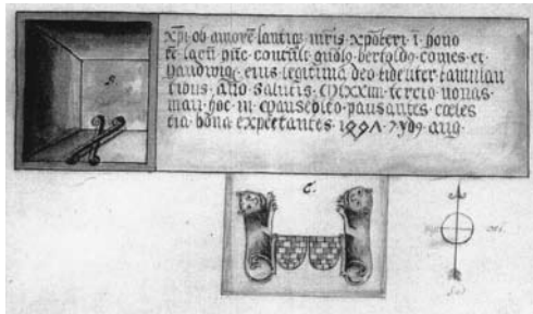
Nachzeichnung von 1761

Die 1497 angefertigte Memorialinschrift nimmt deutlich Bezug auf die beiden 1072 und 1074 angefertigten Urkunden, deren Wortlaut dem Verfasser vorgelegen haben müsste. So überträgt er das Tagesdatum der 1072 ausgefertigten Urkunde „III. No(nas) Mai“ auf die ohne Tagesdatum gebliebene Urkunde von 1074, an die er sich in der vorliegenden Inschrift anlehnt. Nicht mehr zu klären ist jedoch, ob die Inschrift von 1497 eine ältere kopiert oder ob sie völlig neu angefertigt wurde, nachdem das Stiftergrab vernichtet war, um somit wenigstens die Erinnerung an die einst so großherzigen Stifter wachzuhalten.