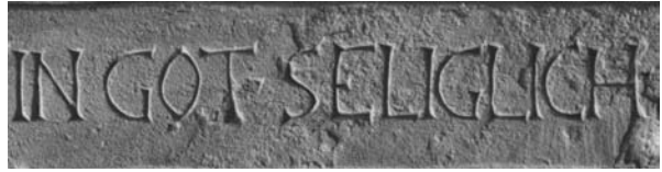
Grabplatte der Christine Sinter (Sünder) (Nr. 4)

wie ausgeprägte Serifen besitzen. Die Kapitalis bleibt – in mehr oder weniger geschickter Umsetzung – die epigraphische Schrift der Spätantike und des Frühmittelalters. Die klassischen Kapitalisformen und ihre charakteristischen Merkmale werden erst in der Renaissancekapitalis wieder aufgegriffen. Diese jüngeren Kapitalisschriften des 15. bis 17. Jahrhunderts weisen nur in seltenen Fällen die strengen Konstruktionsprinzipien der antiken Kapitalis auf. Sie kommen in vielfältigen Erscheinungsformen vor, z.B. mit schmalen hohen Buchstaben oder als schräg liegende Schriften.