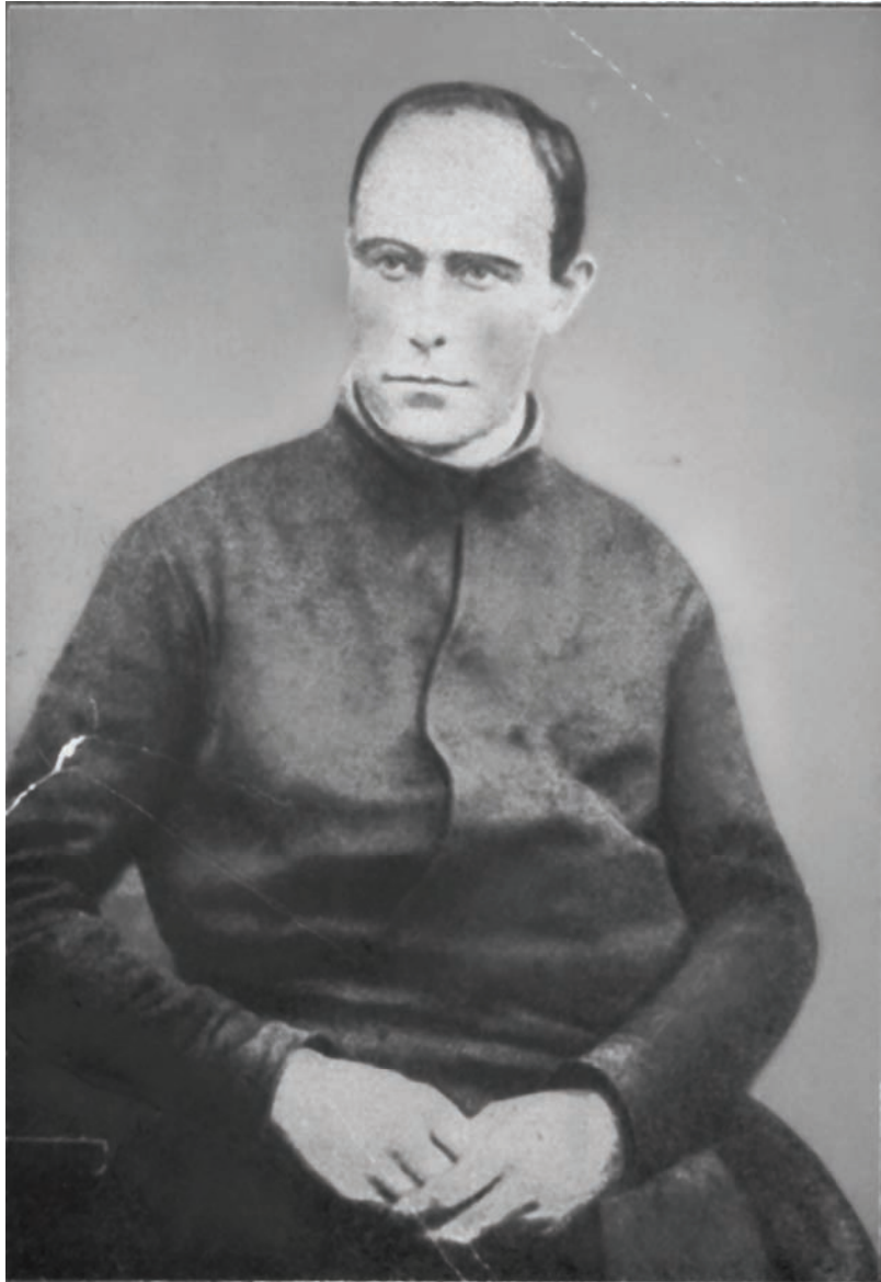
Ketteler als junger Dorfpfarrer in Hopsten (Westfalen)