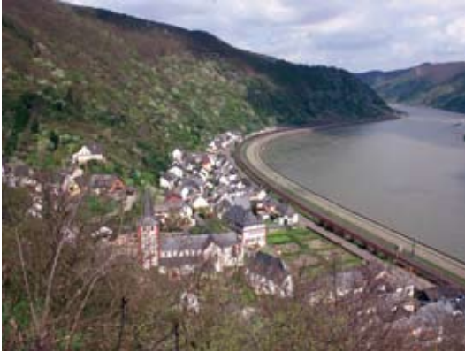
Blick auf die Benediktinerpropstei Hirzenach

mit einem mächtigen, quadratischen Westturm erbaut. Bauherr war die Benediktinerabtei Siegburg (Rhein-Sieg-Kreis), die durch die Errichtung dieser Außenstation die Verwaltung ihrer umfangreichen Güter an Rhein und Mosel sichern wollte. Sehr wahrscheinlich wurde die Propstei in Hirzenach schon vor 1100 eingerichtet – darauf weist zumindest die Schutzherrschaft des heiligen Bartholomäus hin, der in der ersten Hälfte des 11. Jahrhunderts sehr verehrt wurde. Es handelte sich