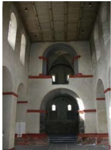
Innenansicht der Kirche während der Renovierungsarbeiten im Frühjahr 2008

In der zweiten Hälfte des 14. Jahrhunderts gelangte die Propstei Hirzenach zu wirtschaftlichem Wohlstand. In der frühen Neuzeit verschlechterte sich die Lage jedoch wieder. Dass die Propsteikirche spätestens im 16. Jahrhundert alle Funktionen der benachbarten, vermutlich etwas älteren Pfarrkirche St. Bartho-