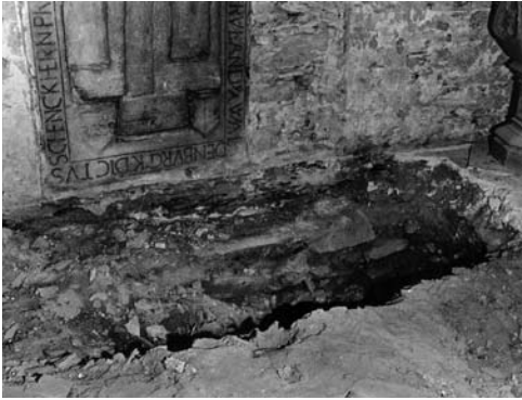
Bemerkenswerter Fund im Jahr 1969: Unterhalb der Grabplatte (vgl. Nr. 1) befand sich ein Grab im Boden

lomäus übernommen hatte, zeigen die zahlreichen Grabkreuze des 16. und 17. Jahrhunderts, die heute noch im Bereich des um die Kirche gelegenen Friedhofs vorhanden sind. Dagegen haben sich nur relativ wenige Grabdenkmäler von Geistlichen in Hirzenach erhalten. Bei den 1968-70 durchgeführten Ausgrabungen im Inneren der Kirche wurden immerhin vierzehn zum Teil in den Fels gehauene Gräber gefunden. Oberirdisch haben sich allerdings nur noch sechs Grabplatten erhalten. Offensichtlich war es in Hirzenach üblich, dass jeweils der