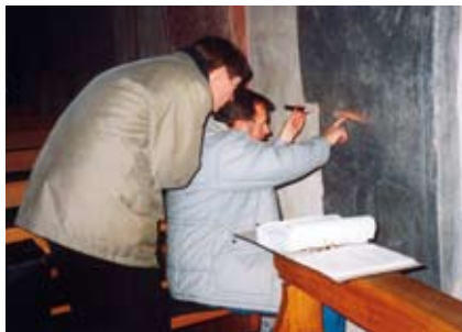
Beim Entziffern einer Inschrift: Epigraphiker bei der Arbeit

Welch interessante Erkenntnisse Inschriften bieten können, möchte Ihnen diese Broschüre anhand der Denkmäler der heutigen katholischen Pfarrkirche St. Bartholomäus in Hirzenach zeigen. Diese wurde in der ersten Hälfte des 12. Jahrhunderts als romanische dreischiffige Pfeilerbasilika