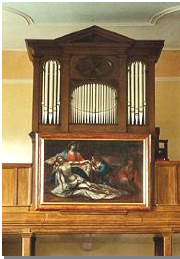
Friedrich Engers-Orgel in der kath. Kirche in Eimsheim